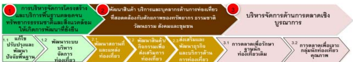
รูปที่ 3.6-1 สรุปกรอบในการดำเนินงานพัฒนากลุ่มจังหวัดภาคใต้ฝั่งภาคใต้ฝั่งอันดามัน

กรอบในการดำเนินงานพัฒนากลุ่มจังหวัดภาคใต้ฝั่งอันดามันเพื่อสนับสนุนเป้าหมาย “ การเป็นศูนย์กลางการท่องเที่ยวทางทะเลระดับโลก บนพื้นฐานของการใช้ทรัพยากรธรรมชาติภาคการเกษตรและความเข้มแข็งของชุมชน ” สามารถสรุปภาพรวมได้ตามแผนภาพด้านล่างนี้